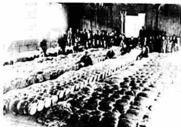
北学校体育館の麻検査・集荷風景

冬の夜の麻かき場は、若い男女の社交の場でもあったと聞きます。(話し)……昔は遊ぶことはなんにもないだからね。今のようにはゴム靴も無かったでワラジや雪の中はゴソソ・ちよつと気取ったやつは下駄なんか履いて、それに着る物(防寒着)が無いから「綿人ば