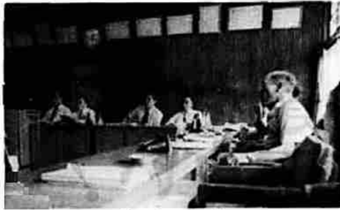
議 会 風 景

○専決報告は、五十一年度の整理予算で、一般会計ほか有線、国保小岩岳保養センターの各特別会計の専決予算が報告されました。一般会計では、義務的経費を極力お