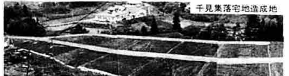
千見集落宅地造成地

電施設を設置します。 これらの事業を実施するため必要な事業費として一億五千五百六十万円の予算を計上しております、これは予算総額の十九・一%も占めております。財源としては、事業費の八十四%を過疎債という借金に頼っており、次いで国の補助金が七一%、残りが一般財源です。