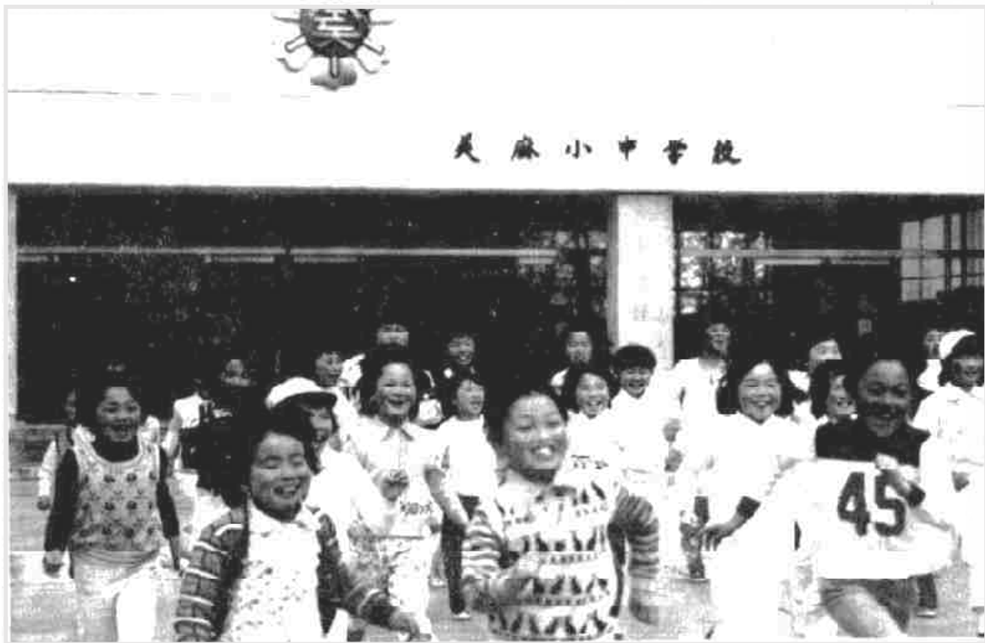
正面玄関から駆け出して来る三・四年生